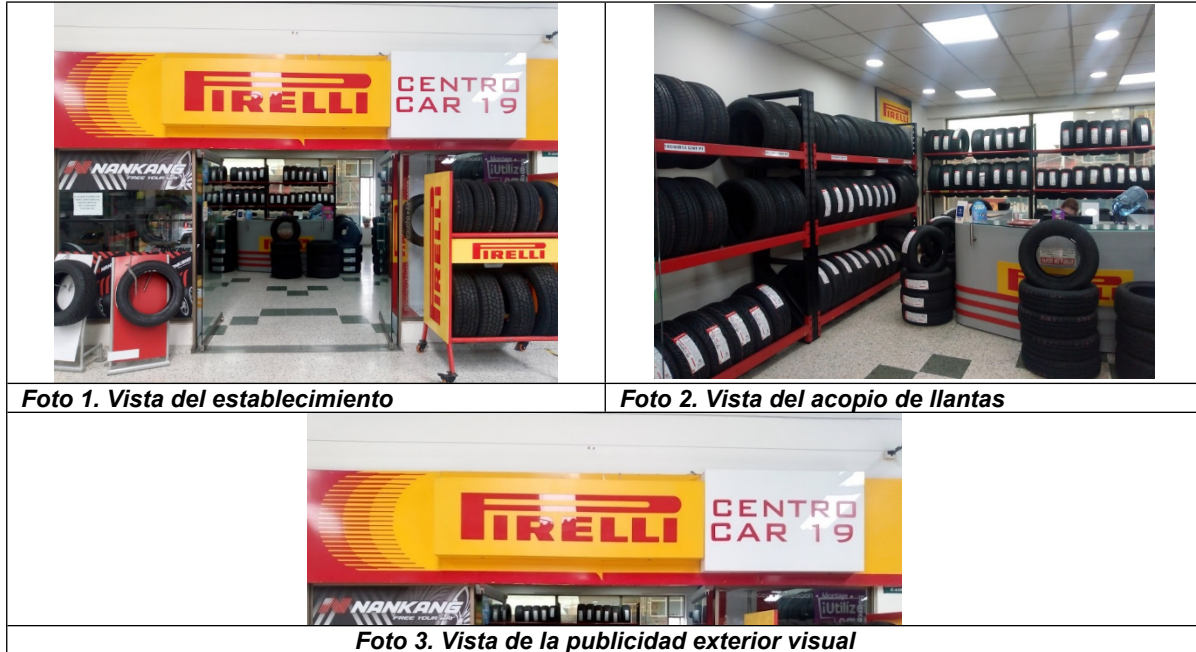
Foto 1. Vista del establecimiento